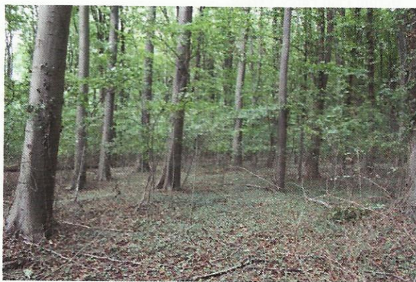
Afb. 2. Biotoop van de Tandloze korfslak ( Columella edentula ) op de Sint-Pietersberg, bovenaan in de zuidrand van het ENCI-bos.

ding). In het bestand van ruim 9.000 waarnemingen hebben er 123 betrekking op vondsten van de Tandloze korfslak. De overgrote meerderheid van die vondsten zijn gedaan in zeer vochtige tot natte biotopen zoals afgeleid kan worden uit omschrijvingen als: "Bronbos", "Kwelijk grasland", "Langs (bron)beek/riviertje", "(Elzen- en/of Essen-) broekbos", "Nat/moerassig populierenbos", "Populierenbos met reuzenpaardenstaart", "Hellingveentje", "Moerasvegetatie", "Rietland", "Veldje met Oever-, of Moeraszegge of Bosbies" en "Weiland met [o.a.] Moerasspirea". Er zijn 18 waarnemingen uit biotopen die niet in deze opsomming passen (15%), waaronder de twee waarnemingen van de Sint-Pietersberg van Majoor & Lever (2003) en van Boesveld (2008, schriftelijke mededeling). Onder de overige biotopen vallen de begroeide taluds van spoorwegen (3), holle wegen (2), een grub, een helling langs de snelweg A76 bij Heerlen en de dijk van het Julianakanaal bij Meerssen. Verder zijn er vijf vondsten uit loofbossen (in Beek, Linne, Swalmen en Wittem 2x) en drie van grazige plekken: grasland bij een drooggevalle poel en een kruidrijk grasland, beide bij Nuth, en onder een stuk hout in grasland langs de Maas bij Grevenbicht.