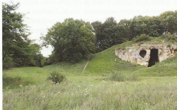
Afb. 1. De Duivelsgrot op de Sint-Pietersberg bij Maastricht (rechts) en de "halve holle weg" (links) en ertussenin het verkeerde "bos (...) achter de Duivelsgrot".

maar die meende ik niet nodig te hebben, want ik was ervan overtuigd dat hij met de halve holle weg de brede strook gras bedoelde die het bos direct achter de Duivelsgrot op de Sint-Pietersberg doorsnijdt (afb. 1). Ik verzamelde tussen 2 mei 2009 en 11 april 2010 op zeven verschillende locaties in dat bos bodemmonsters van ongeveer een liter. Daarin vond ik geen enkel exemplaar van de Tandloze korfslak. Maar erger nog: vergelijking met de aantallen van de soorten uit mijn zeven liter bodemmonster met Boesveld's oogst uit zijn "flinke boodschappentas vol" bodemmonster deden bij mij het