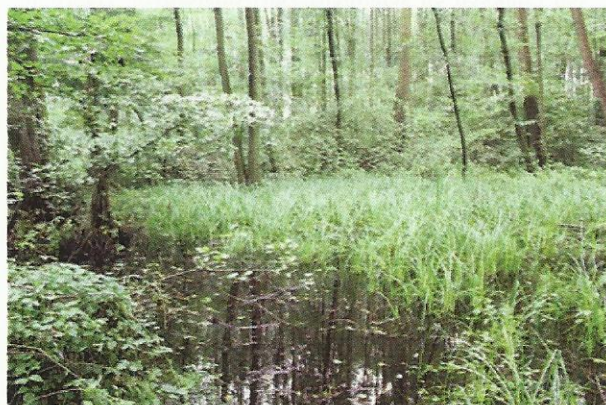
Afb. 3. Voorbeeld van een nat biotoop van de Tandloze korfslak ( Columella edentula ). Terworm, gemeente Heerlen.

Met betrekking tot de biotoop van de overige 15% van de vindplaatsen van de Tandloze korfslak in Limburg kan gesteld worden dat die duidelijk afwijkt van het hierboven beschreven "natte" biotoop. Wat opvalt is dat die biotopen vaak op hellingen liggen: taluds, een dijk, de flank van de Sint-Pietersberg. Ook hier lijkt begroeiing (met grassen, kruiden, Klimop, struweel en/of bomen) voor de Tandloze korfslak een voorwaarde te zijn om er te kunnen leven. Dit biotoop kan omschreven worden als: 'In loofbossen en op met kruiden, Klimop of struweel begroeide hellingen, waar vocht waarschijnlijk wordt vastgehouden tussen humus en bodembegroeiing.