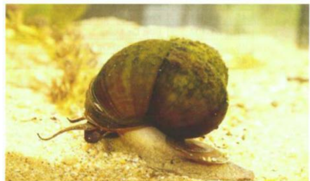
Afb. 2. Vrouwelijke moerasslak ( Bellamya chinensis ).