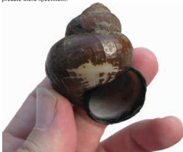
Fig. 1. In 2010 bleek aan tafel bij Gerard Majoor dat de Chinese moerasslak ook in Nederland voorkomt. De verzamelde huisjes uit de Eijsder Beemden waren zelfs een Europees unicum.

In 2015 is voor de populatie in de Eijsder Beemden de COI-barcode beschikbaar gekomen. Deze barcoding is uitgevoerd door NCB Naturalis. De barcode is vergeleken met de databases BOLD, GenBank en DNA Data Bank of Japan (tabel 1). Hierbij bleek dat de barcode van de populatie uit de Eijsder Beemden 100% gelijk was met die van diverse populaties B.