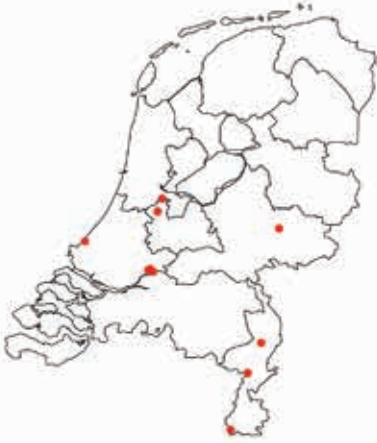
Fig. 2. Verspreiding van de Chinese moeraslak op basis van gegevens t/m 2015. Kaartje: K. Letourneur.