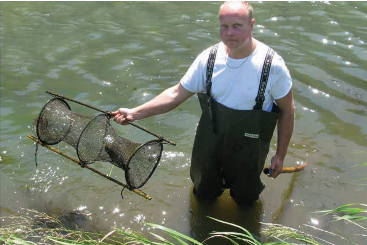
Fig. 8. Met de kreeftenkorf blijken ook Chinese moerasslakken goed te kunnen worden gevangen.

vindplaats is het onduidelijk of het huisje afkomstig was uit de IJssel of de Veengoot. Op 26 oktober 2015 is de locatie door MS bezocht. Vanwege werkzaamheden aan de watergang stond de benedenloop vrijwel geheel droog. Alleen direct onder de stuw stond nog water. Ondanks dat er hier en meer richting de IJssel honderden levende en dode exemplaren waren te vinden van soorten als Gewone poelslak Lymnea stagnalis , Oorvormige poelslak Radix auricularia , Ovale poelslak Radix balthica en Aziatische korfmossel Corbicula fluminea is er geen enkele vertegenwoordiger van de Viviparidae gevonden. Bovenstrooms van de stuw was de Veengoot geheel vergraven en waren sowieso geen slakken meer te vinden. Gezien de afwezigheid van exemplaren benedenstrooms van de stuw is het waarschijnlijker dat het huisje van elders is aangevoerd dan dat er een populatie aanwezig is geweest in het benedenstroomse deel van de Veengoot.