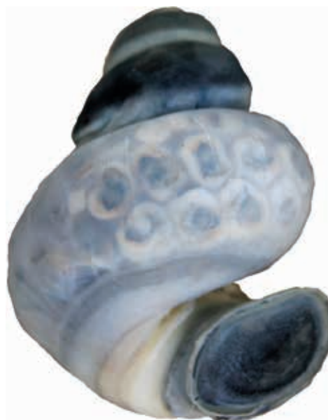
Fig. 10. Lichaam van een vrouwelijke Chinese moerasslak: uterus met juvenielen.

Het aantal dieren dat in de Eijsder Beemden leeft lijkt te zijn afgenomen. Lagen er in 2010 her en der op de oever van de zuidelijke plas tientallen lege huisjes, nu waren het steeds slechts enkele. Het huidige voorkomen is wat nauwkeuriger bekeken. Voor zover vanaf de oever waarneming mogelijk is werd op ongeveer elke twee vierkante meter één volwassen dier gezien. Juvenielen zijn niet gevonden, op een enkele halfwas na. De berekende omtrek van de zuidelijke plas is ongeveer 550 meter en het oppervlak van de plas bedraagt circa 16000 m 2 . Op grond van de waarnemingen vanaf de kant is het aantal aanwezige volwassen dieren zeker 500. Aannemende dat de bodem van de plas overal geschikt is als biotoop voor de Chinese moerasslak en dat de slakken gelijkmatig over de bodem verdeeld zijn zou-