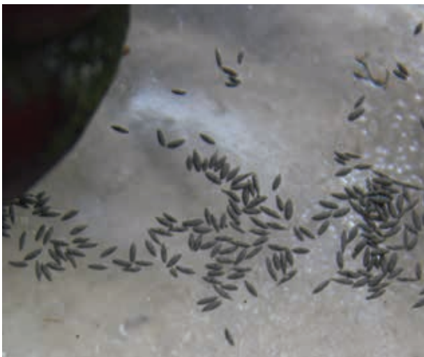
Fig. 4. Uitwerpselen van de Chinese moeraslak; gemiddeld 1,25 mm x 0,59 mm.

In Noord-Amerika is de Chinese moeraslak geïntroduceerd door Japanse immigranten als potentiële voedselbron (Wood, 1892; Hirano et al. , 2015). Geholpen door diverse vectoren, waaronder de handel in aquarium- en vijverdieren (Karatayev et al. , 2009), heeft ze zich over grote delen van Noord-Amerika weten te verspreiden en komt lokaal in hoge dichtheden voor.