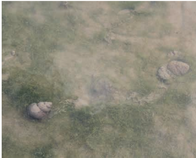
Fig. 3. Volwassen Chinese moeraslakken zijn meestal voor minimaal de helft ingegraven en trekken goed zichtbare banen door de modder.

Gestreepte Amerikaanse rivierkreeft. Aangezien in de nabije omgeving van deze locaties groothandelaren voor vijvervis aanwezig zijn, die de dieren ook buiten bewaren in vijvers of drijfbakken, is het idee ontstaan dat de drie soorten gezamenlijk uit Noord-Amerika werden/worden geïmporteerd. Informeren bij diverse groothandelaren in vijvervissen leverde geen aanvullende informatie op.