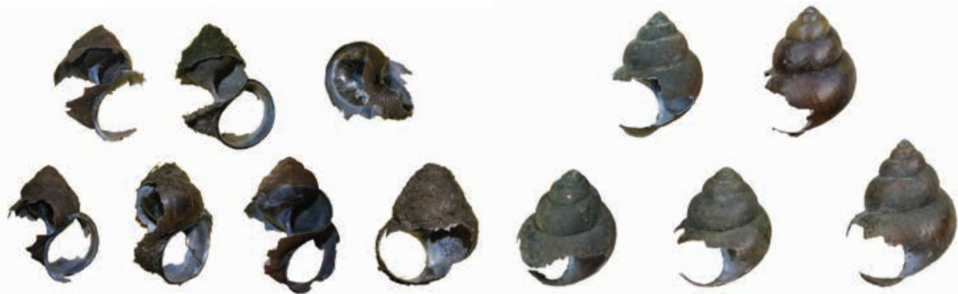
Fig. 5. Door knaagdieren aangebeten huisjes van de Chinese moerasslak uit Amsterdam (links) en de Eijsder Beemden (rechts).

met 'enemy release'. Dit houdt in dat exoten in nieuw gekoloniseerde gebieden minder 'natuurlijke vijanden' in de vorm van parasieten en/of predatoren hebben. In Nederland is nog geen gericht onderzoek gedaan naar parasieten bij de Chinese moerasslak en is alleen de worm Chaetogaster limnaei Baer, 1827 als ectoparasiet waargenomen op dieren verzameld bij Boven-Hardinxveld (D.M. Soes, eigen waarneming). Deze worm is in Nederland zeer algemeen en heeft een breed spectrum aan soorten zoetwaterslakken als gastheer. Bij hoge dichtheden kan deze soort een negatieve invloed hebben op onder andere de groei van de gastheer (Stoll et al. , 2013). Met enkele wormen per slak waren de dichtheden in Hardinxveld-Giessendam laag en waren geen negatieve effecten op de Chinese moerasslakken te verwachten.