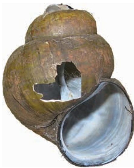
Fig. 6. De Geknobbelde Amerikaanse rivierkreeft blijkt in staat te zijn ook grotere exemplaren van de Chinese moerasslak aan te bijten.

In een fuik in Boven-Hardinxveld is, naast twee grote, levende Chinese moerasslakken, een circa vijf cm groot huisje gevonden dat ook duidelijk was gepredeerd (fig. 6). Ten opzichte van de huisjes die door knaagdieren zijn gepredeerd wijkt deze af doordat vooral de top en een stuk vlak boven de mondopening is weggebroken. Van de soorten die in de fuik aanwezig waren is alleen de Geknobbelde Amerikaanse rivierkreeft ( Orconectes