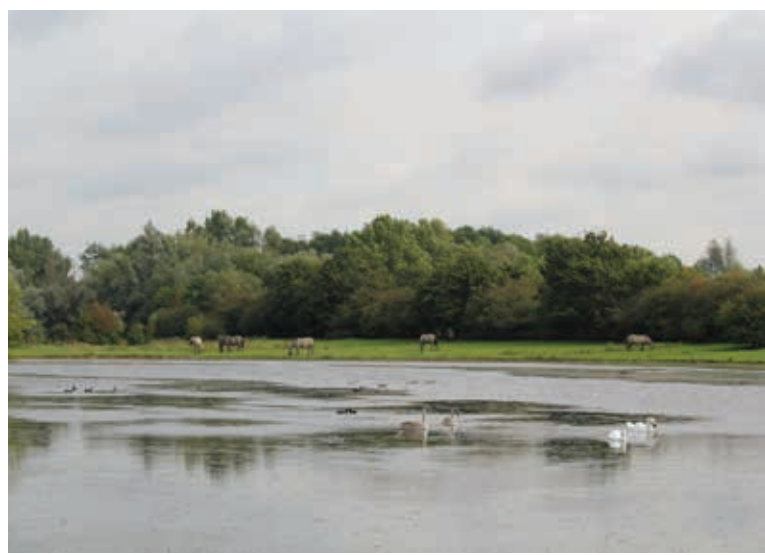
Fig. 7. Watervogels zijn in de Eijsder Beemden waarschijnlijk belangrijke predatoren.