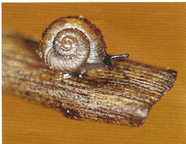
Fig. 1. Het Duintolletje ( Paralaoma servilis ).

Het rechtsgewonden huisje is heel klein (breedte 1,5-2 mm, hoogte 1-1,3 mm) (fig. 1), maar iets groter dan het Dwergpuntje Punctum pygmaeum . De vorm is laag konisch; de schelp is dunwandig. De kleur van het huisje is hoornbruin en soms een beetje groenig. Het huisje heeft 3½ tot 4½ bolle, licht gekielde omgangen met duidelijke, fijne radiale ribben die onderling geen regelmatige afstand hebben. Tussen de ribben is een fijne spiraal-sculptuur aanwezig. De navel is diep en rond en neemt ongeveer 1/4 e van de diameter van het huisje in beslag. De mondrand is onderbroken, scherp en heeft geen verdikking.