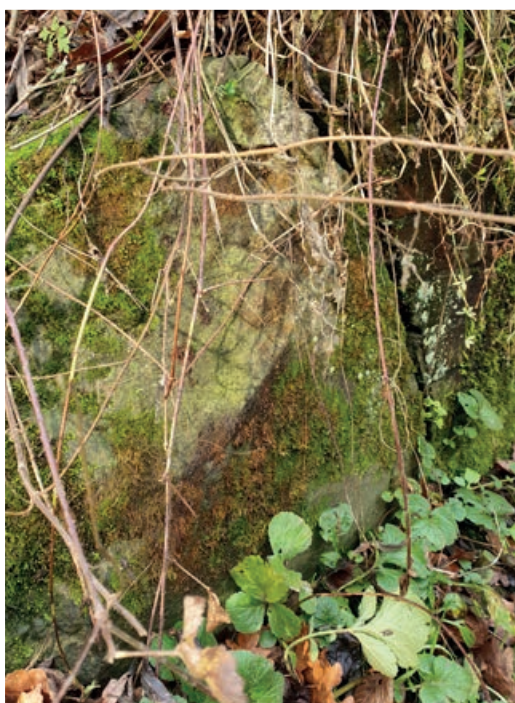
◀ FIGUUR 5 Blok natuursteen op de punt van het muurtje aan de noordkant van de tunnel (foto: Gerard Major).

vindplaats van de mutsnaaktslakken is toen niet onderzocht. Er is daarom geen aanwijzing hoe lang de mutsnaaktslakken al in Roodborn aanwezig zijn.